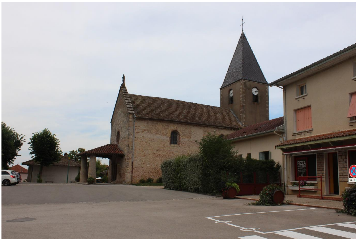
Parking et terrasse du commerce