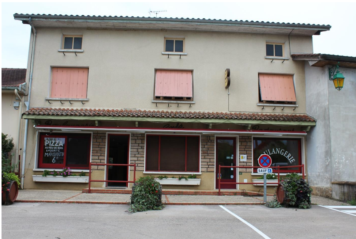
Façade du commerce