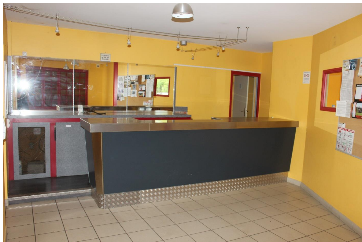
Vue intérieure de l'ancien restaurant côté bar