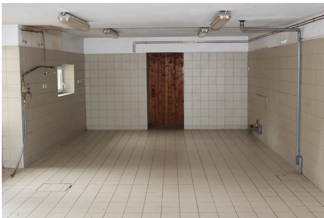
Autre laboratoire (ancien fournil)