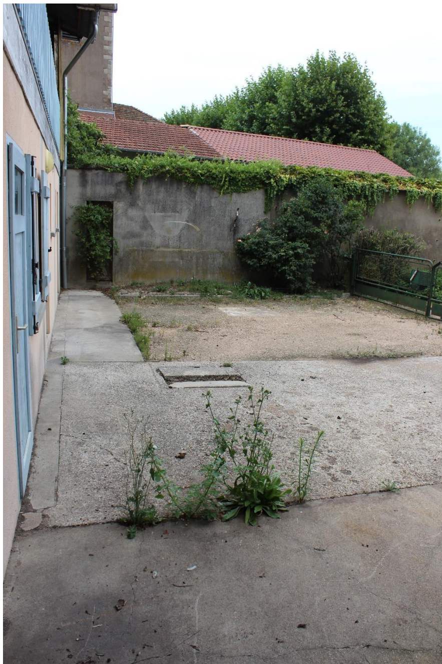
Cour extérieure derrière le commerce