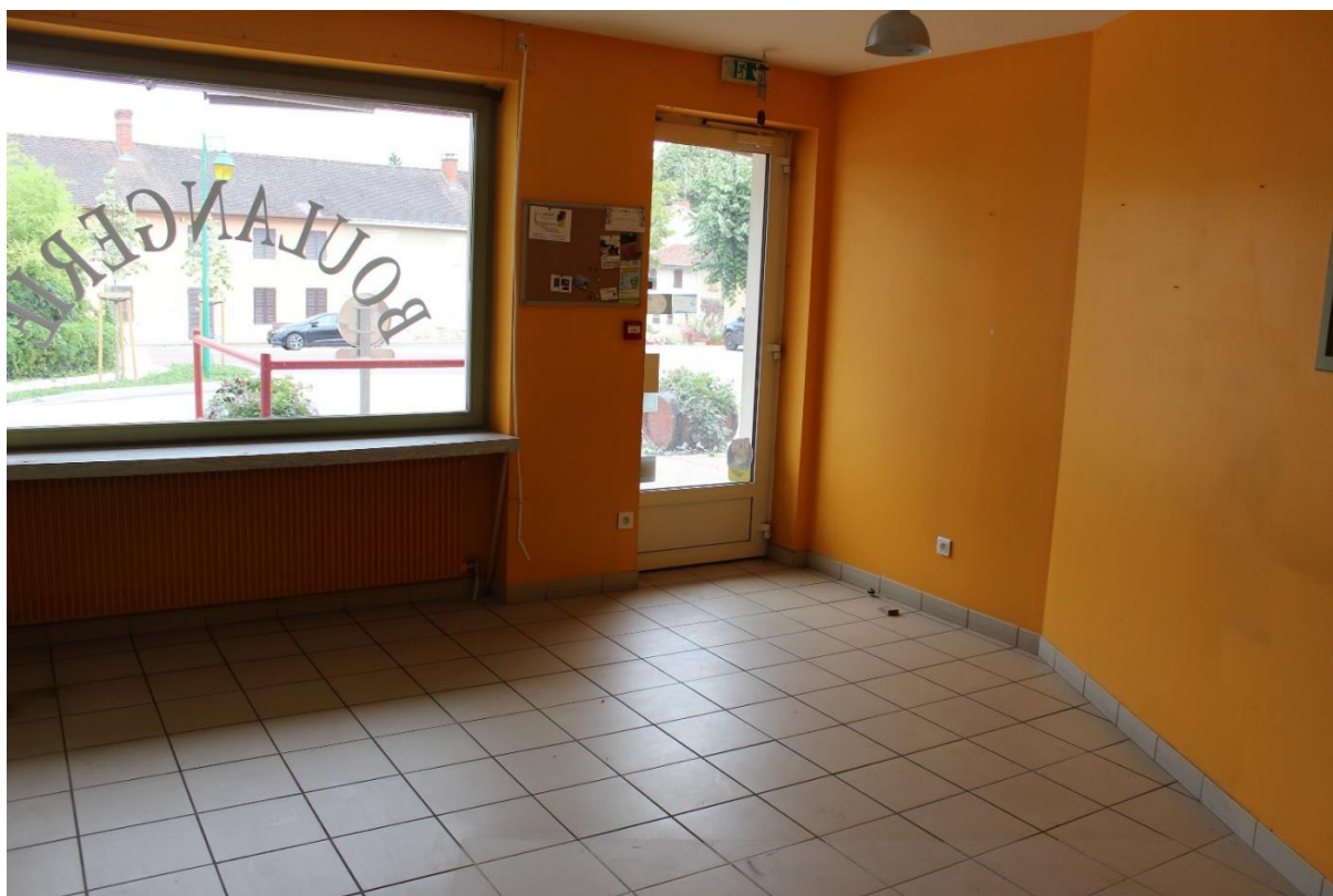
Local de l'ancienne boulangerie